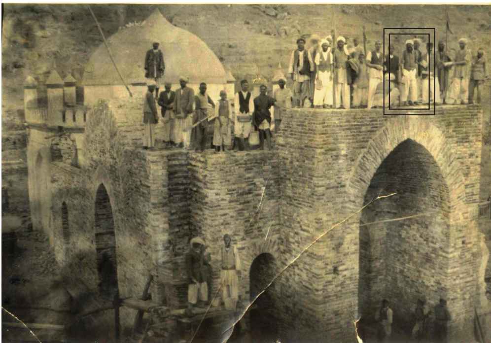
حضرت آیت الله العظمی حجت (ره) در حال ساختن گنبد زیارت سخی