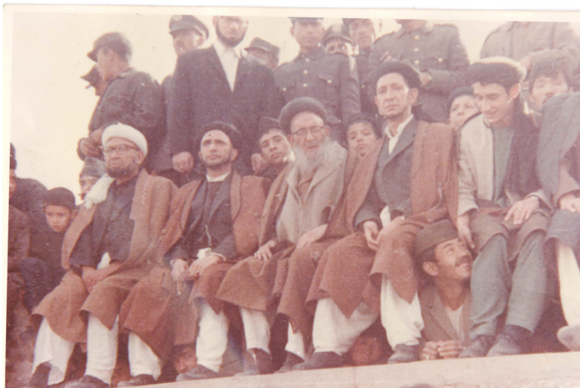
حضرت آیت الله العظمی حجت (ره) در زیارت سخی به مناسبت برافراشتن بیرق مولا علی (ع) در روز نوروز